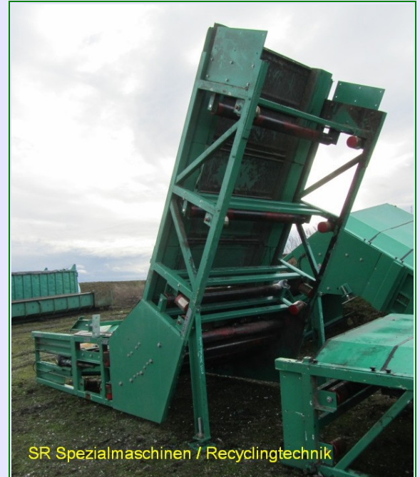
SR Spezialmaschinen / Recyclingtechnik

Preis Pos. 03 ( inkl. neuer Fördergurt ) : 24.800 EUR, netto, gebraucht, ohne Garantie, aufgeladen, ab Werk Ennigerloh ( D )