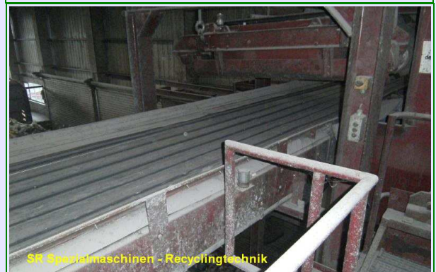
SR Spezialmaschinen - Recyclingtechnik