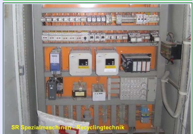
SR Spezialmaschinen - Recyclingtechnik