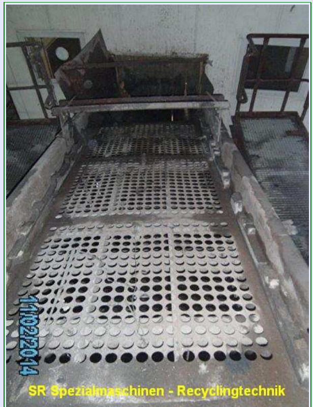
SR Spezialmaschinen - Recyclingtechnik