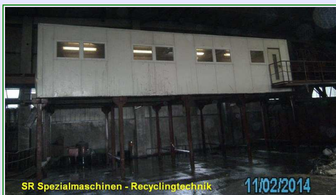
SR Spezialmaschinen - Recyclingtechnik